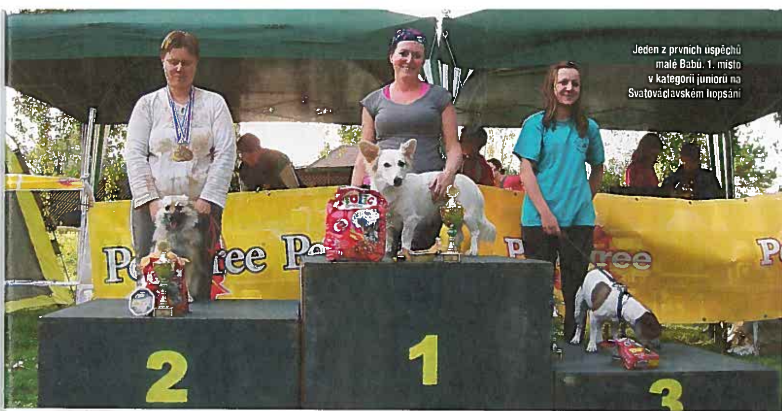
Jeden z prvních úspěchů malé Babů. 1. místo v kategorii juniorů na Svatováclavském hrošání