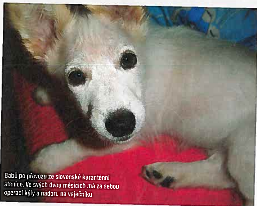
Babu po převozu ze slovenské karanténní stanice. Ve svých dvou měsících má za sebou operaci kýly a nádoru na vaječniku

Její šance na přežití se ale přemístěním do karanténní stanice nijak nezvýšily. I přes maximální snahu dobrovolnic řádila ve stanici smrtelná parvoviróza, pro neočkovanou a podvyživenou Babu jedno z největších nebezpečí. Zdravotní stav Babu se zhoršoval s každým dnem. Oostala štěněcí kýly, po tělíčku se jí rozlezl kožní ekzém a krvavé strupy, téměř veškerá srst jí vypadala. Už se zdálo, že se na Babu konečně usměje štěstí, když se dobrovolnicím podařilo umístit ji alespoň do dočasné péče. Odtud se ale po několika dnech vrátila znovu do karanténní stanice s tím, že je příliš živá a nezvladatelná. Tolik potřebnou veterinární péči tak vůbec nedostala.